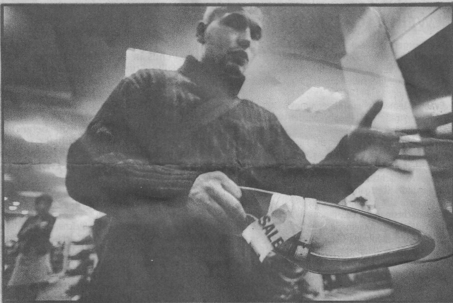
Der 23-Jährige geht erst einmal einkaufen: weiße Slipper mit Schnallen.